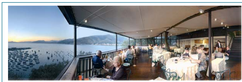
Terrasse des „Restaurants Dei Castelli“

Das Tagungspaket versteht sich als unverbindliches, freibleibendes Angebot netto zzgl. gesetzlicher MwSt. und ist nur buchbar auf Anfrage über den Reiseveranstalter Liguriaplus als exklusiver Partner vom Hotel Dei Castelli. Die Preise verstehen sich inkl. Reisepreissicherungsschein und basieren auf einer Mindestteilnehmerzahl von 20 Personen mit Anreise am Sonntag, Montag oder Dienstag in den Monaten 19.03. – 18.05.2010 und 19.09. – 29.10.2010 und variieren nach Verfügbarkeit, Saison, regionalen Veranstaltungen, Feiertagen und Buchungszeitpunkt. Nicht inbegriffen sind An- und Abreise, Extras, Trinkgelder, Versicherungen. Je nach Verfügbarkeit und Teilnehmeranzahl unterbreiten wir Ihnen ggfls. ein Angebot für nahegelegene Hotels. Gerne erstellen wir Ihnen ein Angebot mit weiteren Tagungsräumlichkeiten gemäß Ihrer individuellen Vorstellungen sowie ein Rahmenprogramm wie z. B. Yacht- oder Bootscharter, Exkursionen/Besichtigungen, Weinprobe/Degustation, Cocktailempfang am Strand, Running Dinner, Special locations (Aquarium, Antike Paläste, Beachclubs, Villen, Gärten...) Kochkurs, sportliche und kulturelle Aktivitäten, Teambuilding u. v. m.