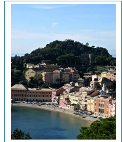
Tagungslage Hotel Dei Castelli auf der Halbinsel von Sestri Levante

ligurischen Levante-Küste zwischen dem mondänen Portofino und dem UNESCO-Weltkulturerbe Cinque Terre gelegen, ist die Kleinstadt Sestri Levante sowohl mit dem Auto als auch per Flugzeug über Genua, Pisa oder Mailand leicht zu erreichen.